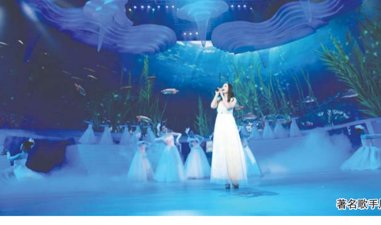
著名小品演员贾玲献唱