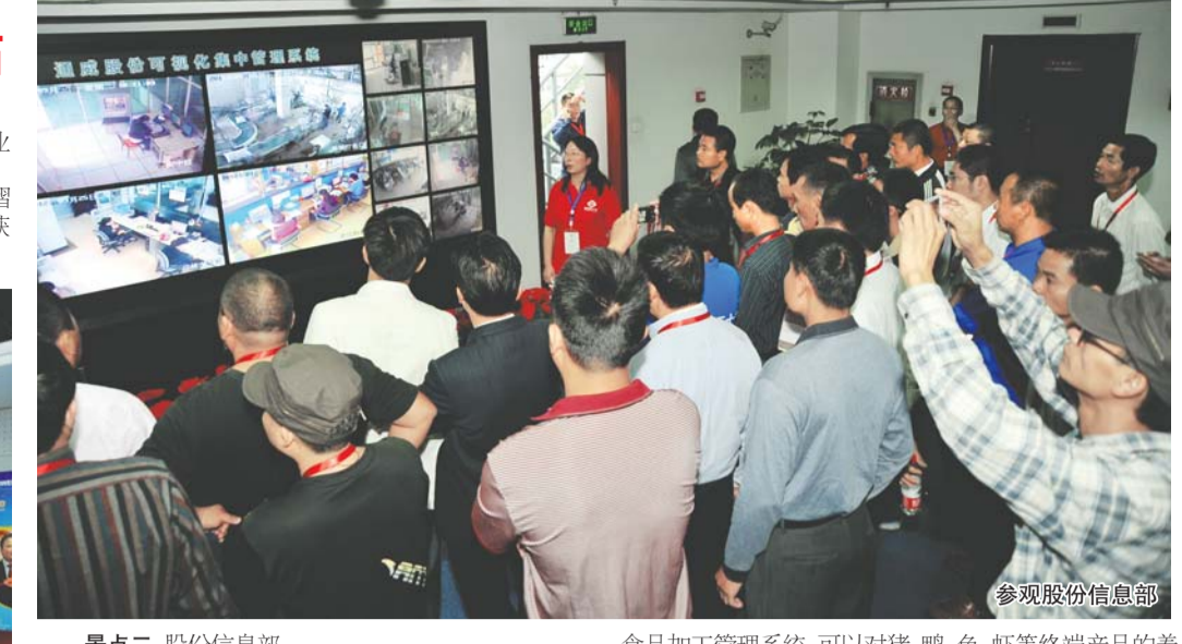
参观股份信息中心