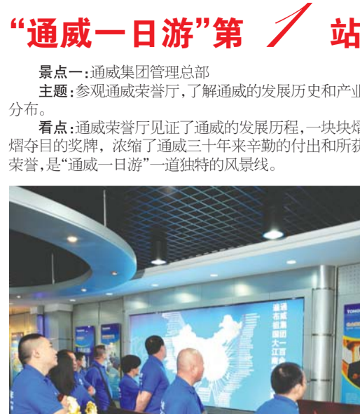
参观管理总部荣誉展厅