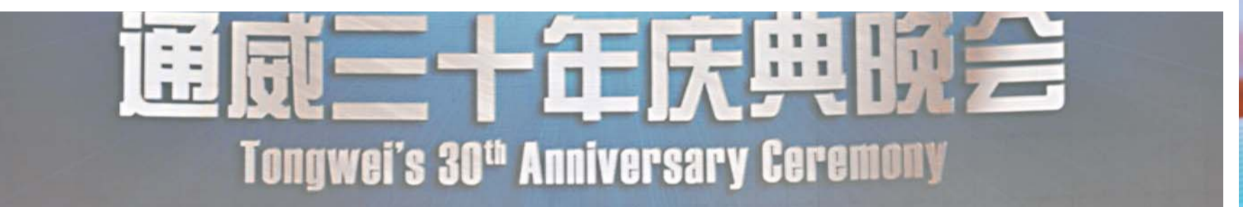
通威三十年庆典晚会 Tongwei's 30th Anniversary Ceremony