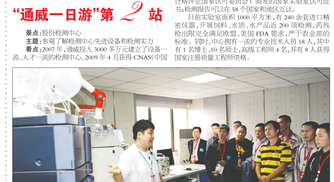
参观股份信息中心