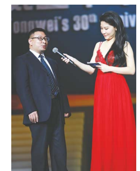
通威董事长(左)接受奖杯