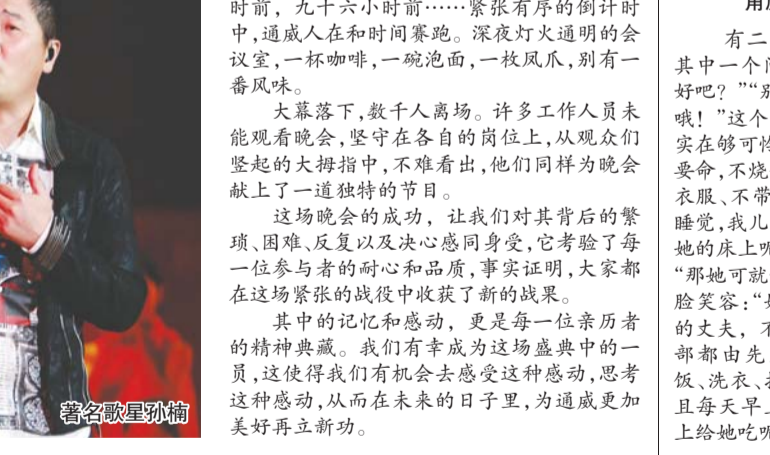
著名歌手转韵唱起