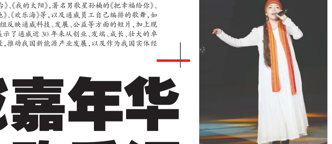
著名歌手转韵唱起