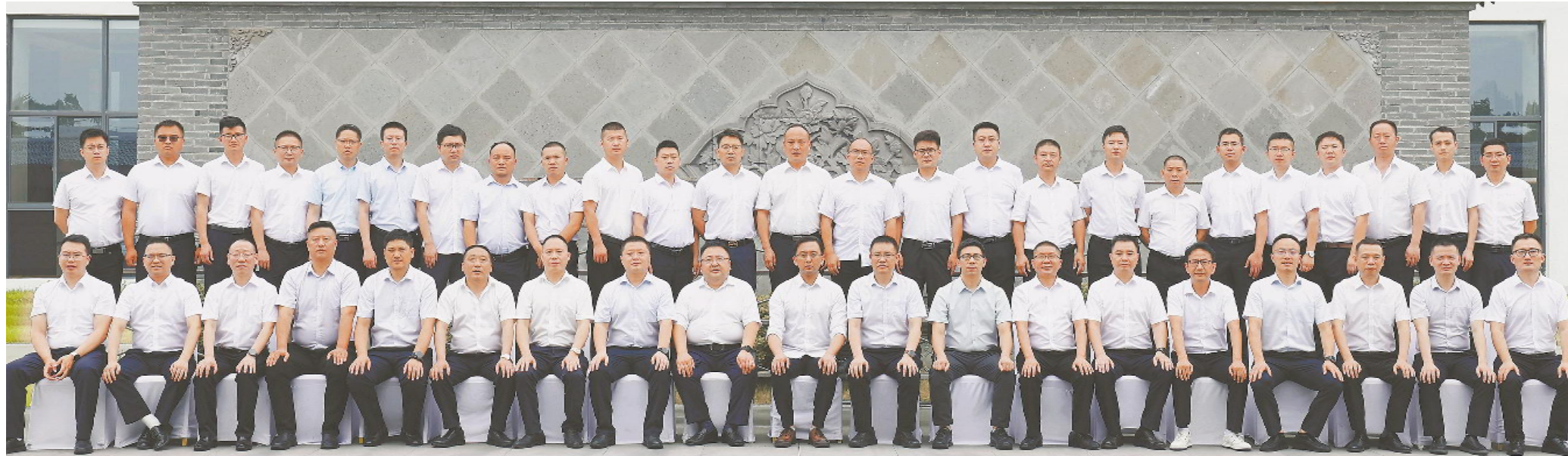
通威农发华东一区 2024 年上半年经营总结暨下半年经营规划会合影留念

记者 冯书遐 通讯员 庞晓娟 崔锐芬 赵珍珠 谭伟 蔡菲 刘观霞 阮氏泉 蔡菲 马侨