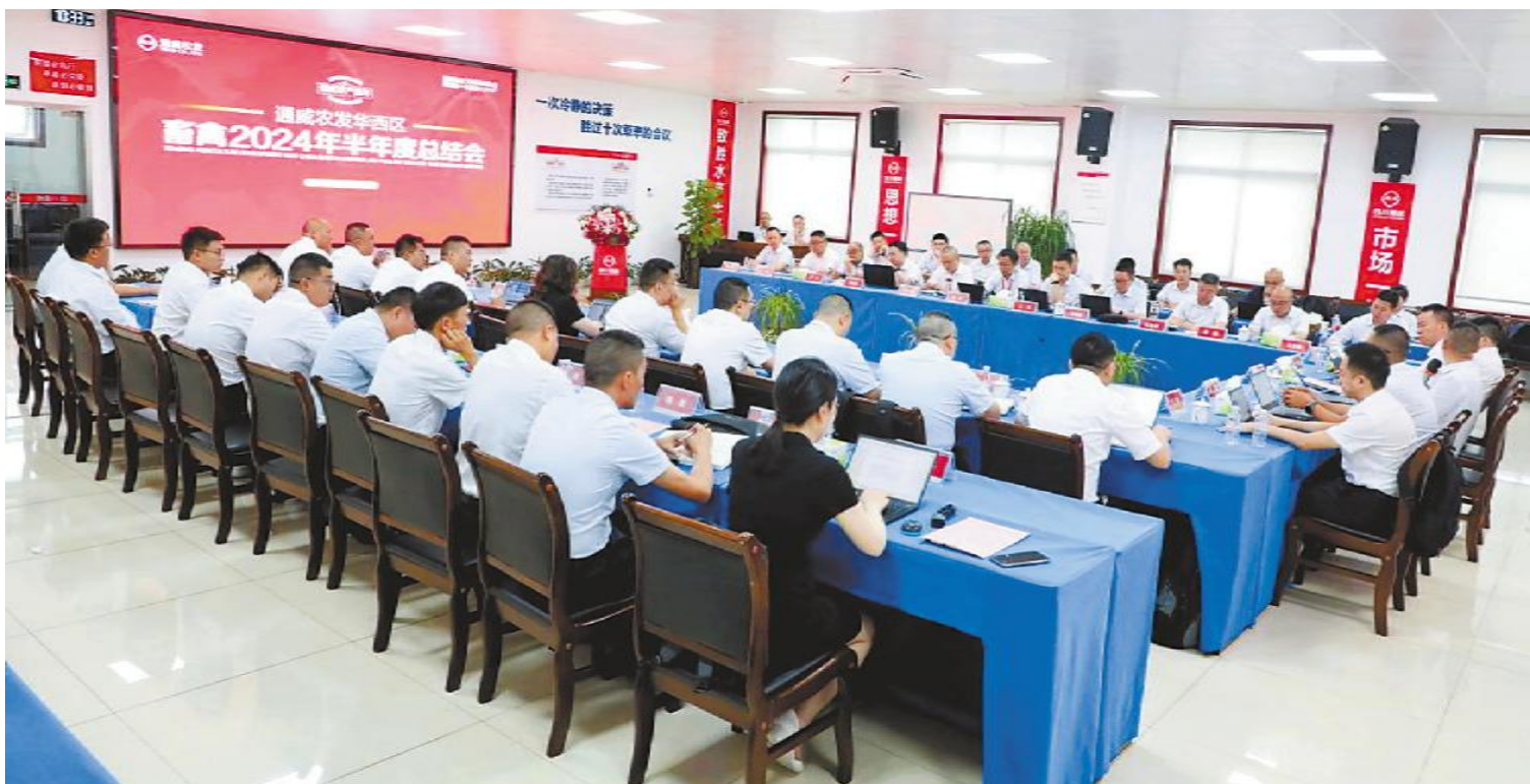
通威农发华中区畜禽 2024 年半年度总结会现场