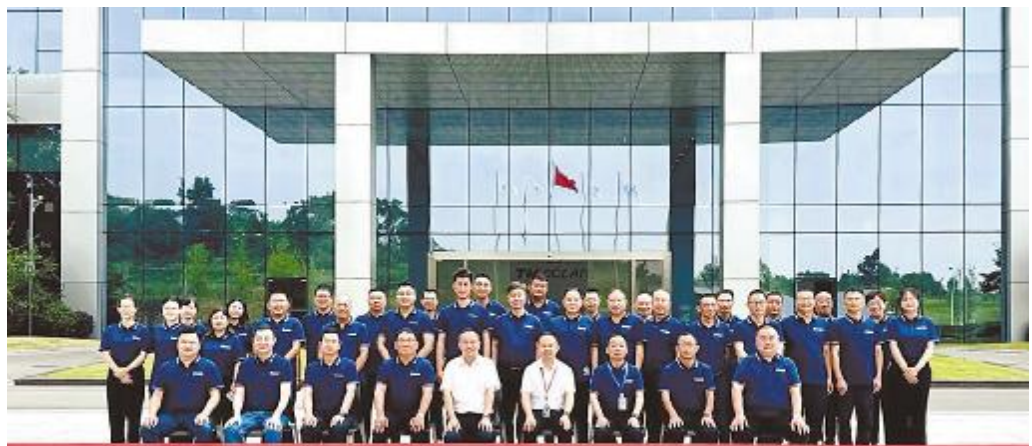
通广建设 2024 年半年经营分析会合影留念

郭总认真听取了大家的工作汇报,回顾了通广建设的发展历史,充分肯定了通广建设近几年发生的翻天覆地的变化,现在各板块逐渐对通广建设出现夸赞的声音,公司业绩也一年上一个台阶。但在经济环境低迷,各行各业遭遇寒冬,公司业务面临缩减,下半年任务开发压力巨大,公司应戒骄戒躁,思考如何有效经营、长远经营,希望公司全体同仁戮力同心,脚踏实地,一起“穿越寒冬”。