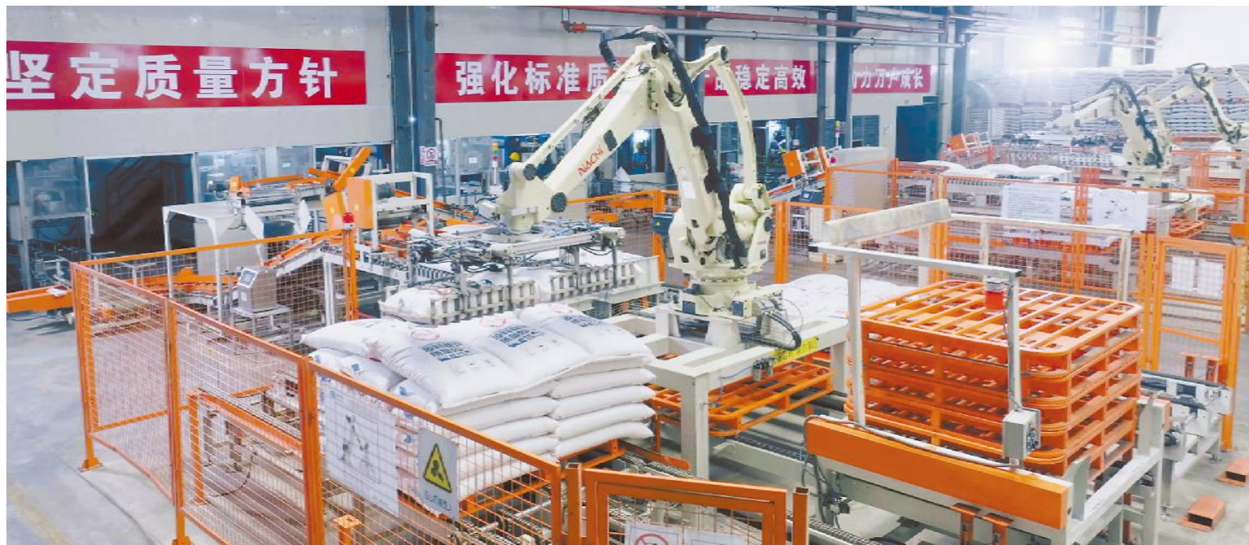
通威自动化、智能化生产现场