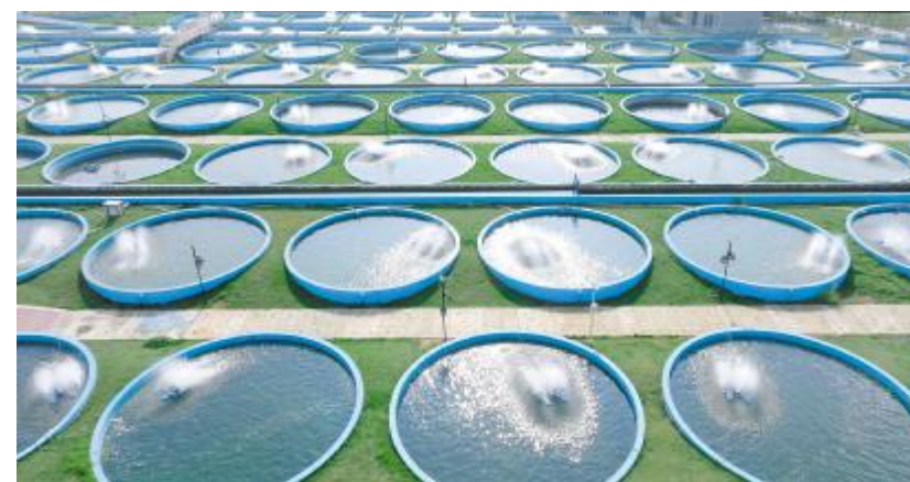
通威现代渔业产业园

自刘汉元主席亲自重塑“质量方针”以来,通威深入践行专业化、标准化、规模化,在行业首先完成全部工厂的标准化建设,颠覆饲料行业的刻板印象,打造食品级现场,引进智能化设备,实现生产全流程实现自动化、智能化、标准化。同时,不断优化产品配方,660余人的科技