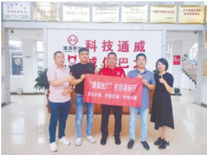
数说水产《唐探优厂》栏目调研行走南通巴大饲料有限公司