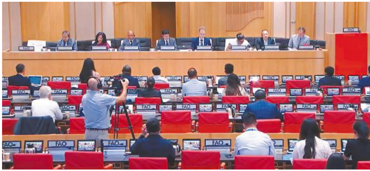
联合国粮食及农业组织(FAO)渔业委员会第36届会议现场

多年前建立的区域网络在促进合作伙伴之间的知识共享与合作方面发挥了重要作用,并得到了学术界和业界的大力支持。近期,《可持续水产养殖准则》经过八年的全球协商正式通过,作为全球水产养殖大国,中国举办“深化区域合作,实施《可持续水产养殖准则》”主题边会,旨在为参与者提供交流机会,分析全球水产养殖发展的机遇、问题和挑战,促进包容、有韧性和高效的水产养殖发展。