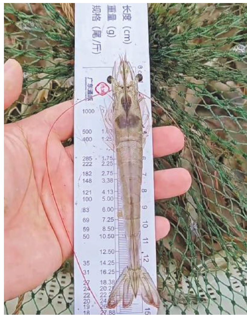
使用通威饲料养殖出的优质对虾