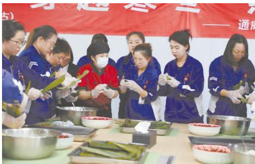
通威绿材(内蒙古)包粽子活动现场

永祥股份追光者龙舟队队员全部来自生产一线,他们利用业余时间,勤学苦练,用行动展示不断超越、砥砺奋进的新时代企业职工风采。队员们表示,他们深知,作为永祥的一份子,肩负着为公司争光的重任。在接下来的日子里,全体队员将继续努力,不断提升自己的实力,为未来的比赛做好充分准备。期待他们在更多的比赛中再创佳绩,为公司带来更多的胜利和荣誉。