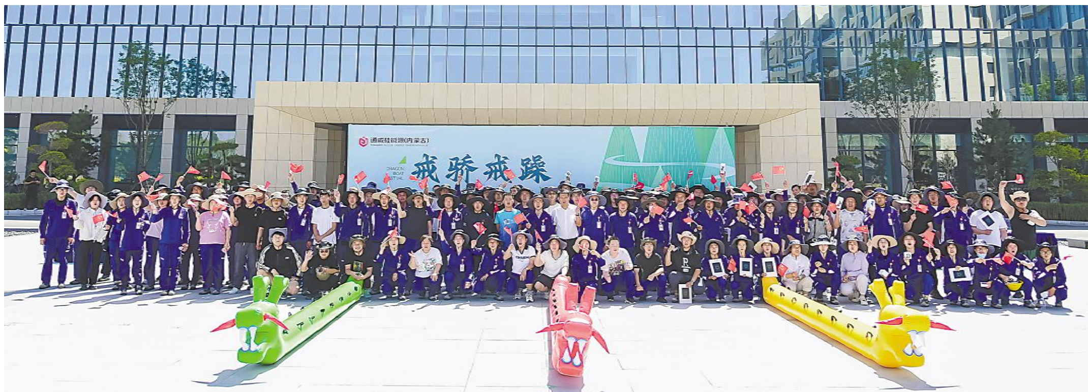
通威硅能源(内蒙古)端午节主题活动现场

记者 冯书遐 龙小龙 通讯员 鲍清华 郭锐 谢梦桥 何宇 王玮华 戈云伟 杨金鑫