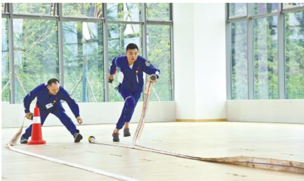
永祥能源科技安全知识技能竞赛活动现场