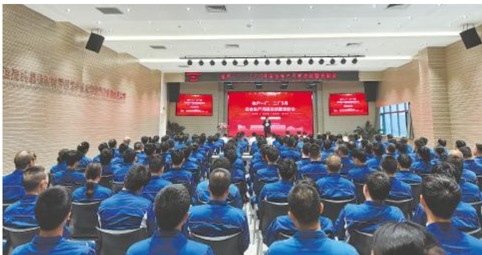
永祥光伏科技安全生产月总结表彰会现场