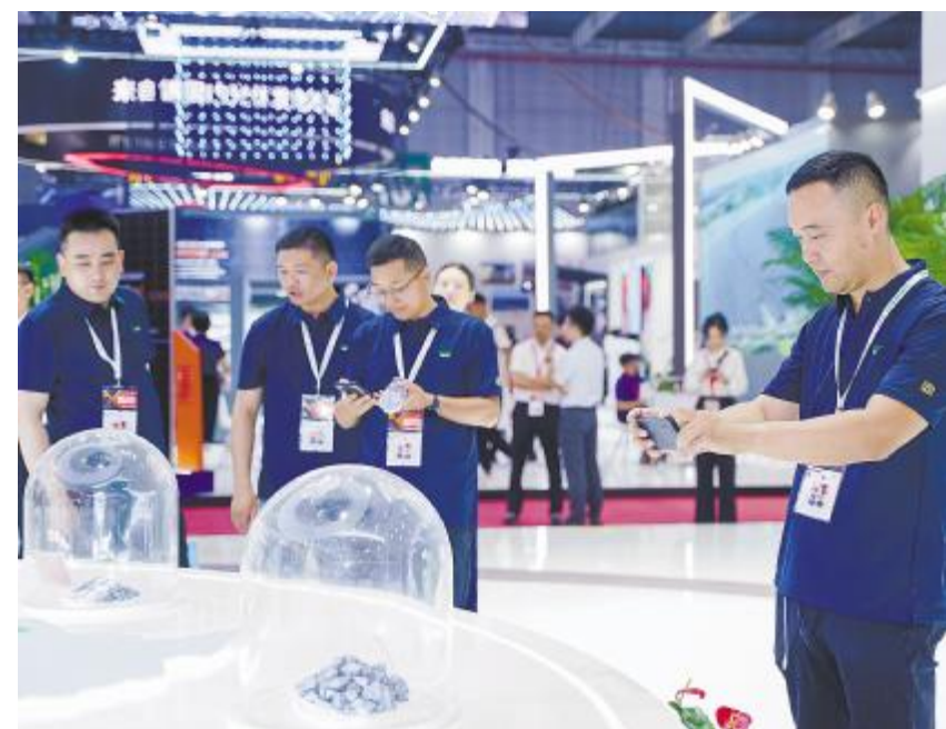
参展客商详细了解永祥股份高纯晶硅