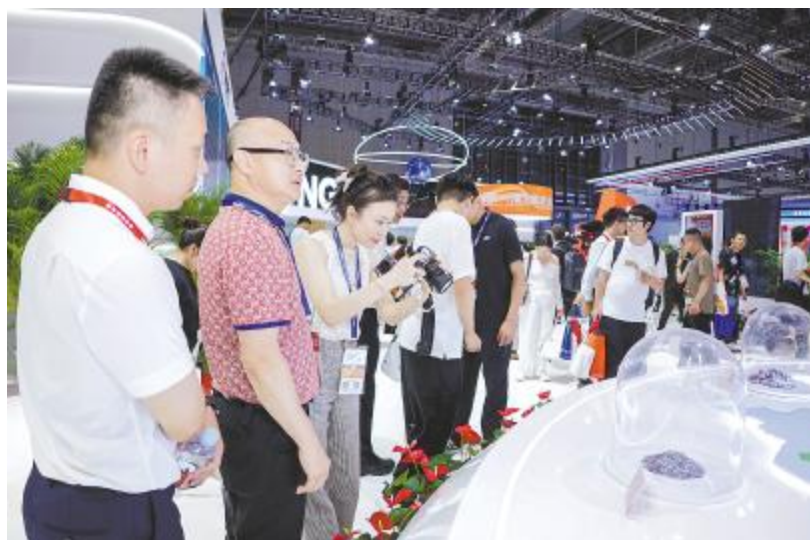
永祥股份高纯晶硅产品亮相2024SNEC