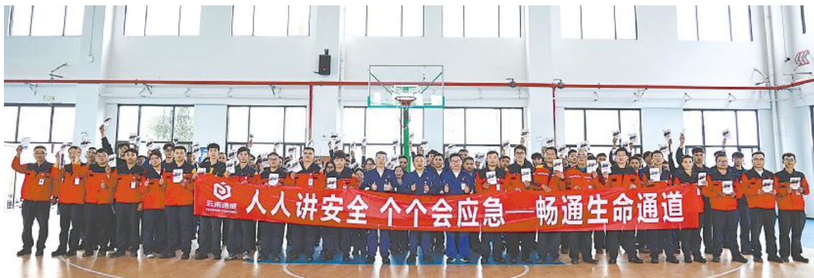
云南通威“安全宣传咨询日”活动合影