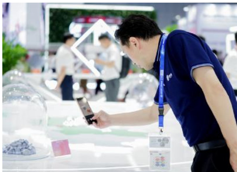
观展客商关注永祥股份高纯晶硅产品