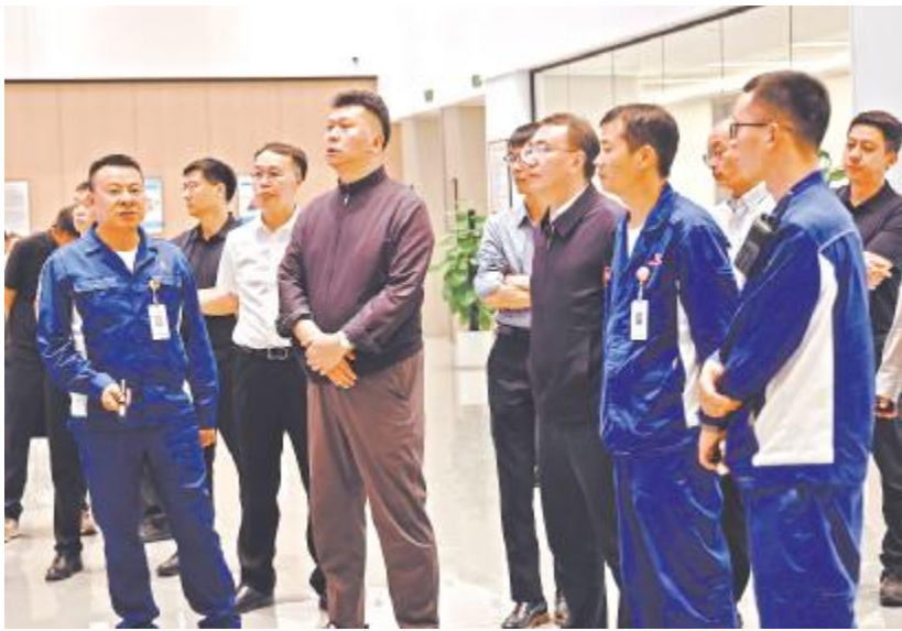
云南省副省长王浩参观云南通威集控中心

王浩副省长对云南通威的工艺技术创新、智慧化运用、绿色工厂建设等给予高度评价,并表示,像通威这样拥有全球领先技术、核心竞争力的优质企业,政府会全力支持。未来,省委、省政府将遵循市场发展规律,加快整合产业上下游资源,打通光伏行业高效发展渠道,强化要素保障为重点的