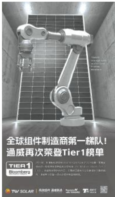
通威再次荣登 Tier 1 榜单

在产品品质方面,通威实行严格的 6 大质量管理体系,确保每一件组件产品都符合国际标准。此外,凭借硅料和电池端的双龙头优势,通威在海内外政府项目竞标中脱颖而出,收获了 40 余个国家和地区客户的广泛认可。