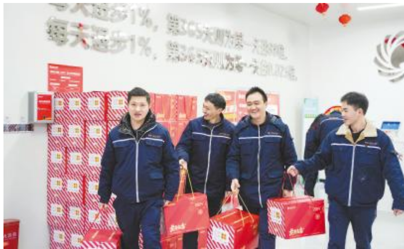
春节大礼包,祝福暖心间