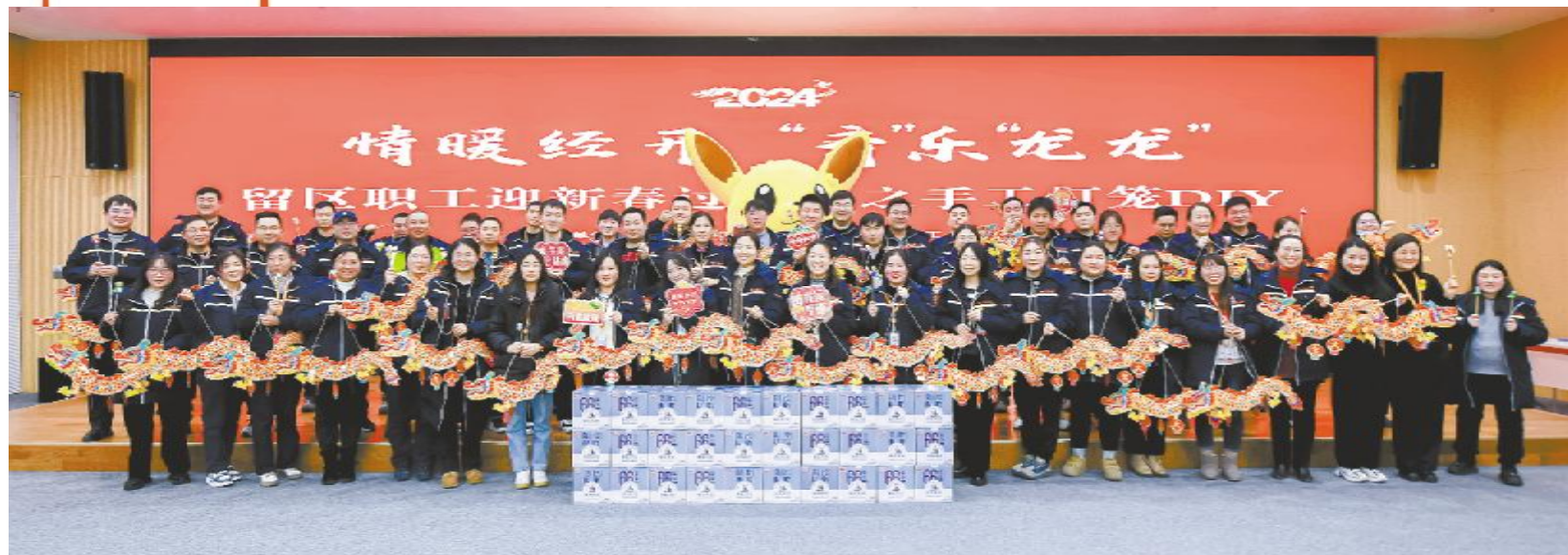
通威太阳能科技开展迎新春系列活动