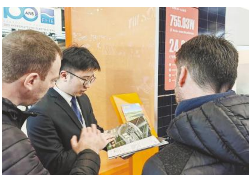
推介通威组件新品