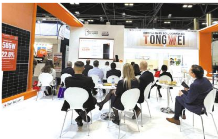
通威产品技术推广会现场