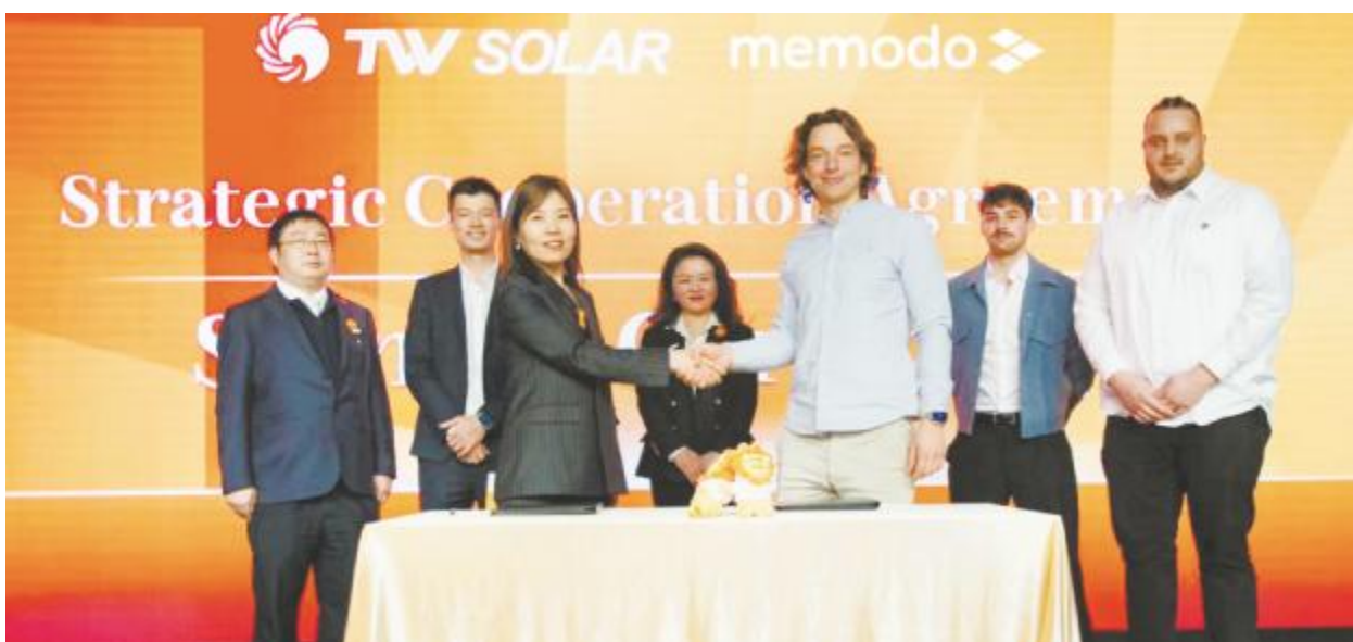
通威与德国 Memodo 集团签署 300MW 组件供货协议