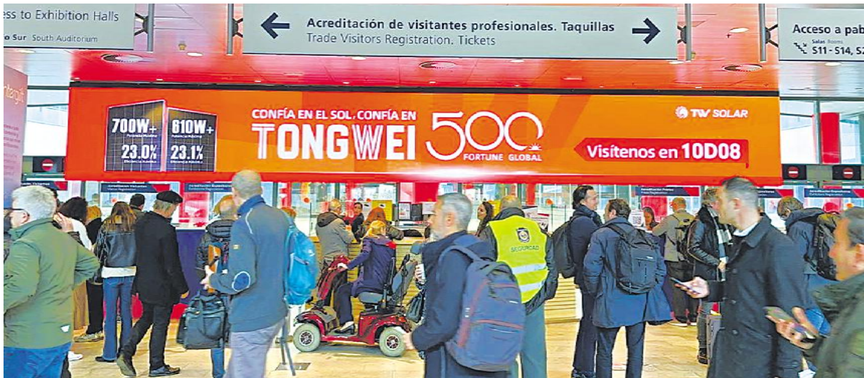
通威“智造”亮相西班牙马德里各大主要交通枢纽