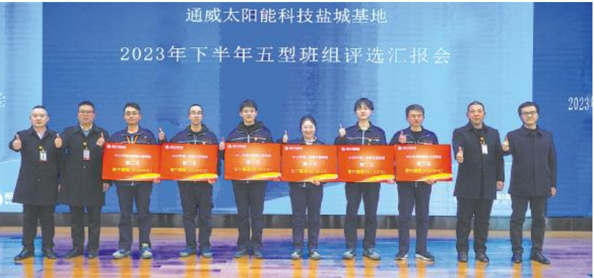
通威太阳能科技2023年五型班组评选盐城基地颁奖现场