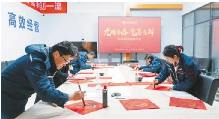
合肥基地写春联送祝福现场