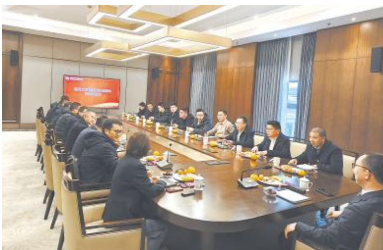
通威太阳能科技盐城基地举行管理干部新年茶话会