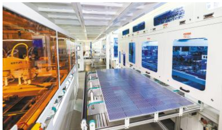
通威高效组件智能制造生产线

会上,各基地围绕中心思想,就产能提升、人力精简、材料优化、能耗降本、设备机械改造等多个项目进行详细汇报,群策群力,从预估设想案例分析,各项方案不断碰撞,共同寻求降本增效、提升效率的有效路径。