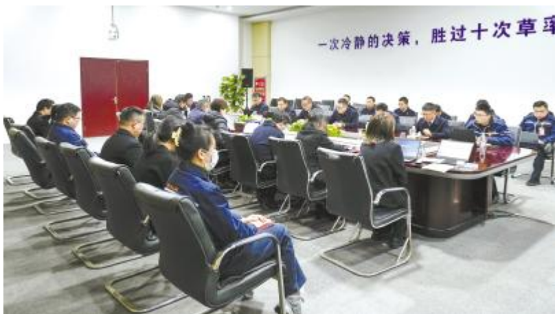
合肥基地会议现场

面对行业新周期、新挑战,光伏企业尤其是组件生产端如何应对?成为大家共同需要思考的问题。刘汉元主席指出,就算行业不景气,就算企业处于新常态,只要我们改变自己,能够真正有效地发挥团队的主观能动性,每天都是“春天”,年年都有“夏天”,否则我们可能长时间处于“冬天”。同时,主席也深刻指出,好日子抓住了,打了胜仗,是对团队最好的激励。我们一定要在所专、所精、所强方面,真正进一步练好内功,磨好金钢钻,攥好市场的瓷器活,使大家在该跑的时候跑起来了,