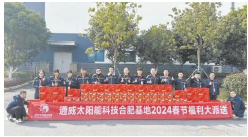
合肥基地开展春节福利大派送

让员工自主选取节日大礼包。应季新鲜水果、腊味香肠、坚果零食、特色小吃等装满整个福利箱。一盒盒礼包,一箱箱水果井然有序地发放到每一位员工手中,温暖的祝福也传递到每个人心里。员工们的脸上洋溢着幸福的笑容,各基地笼罩在一片欢声笑语、温馨祥和的喜庆气氛中。