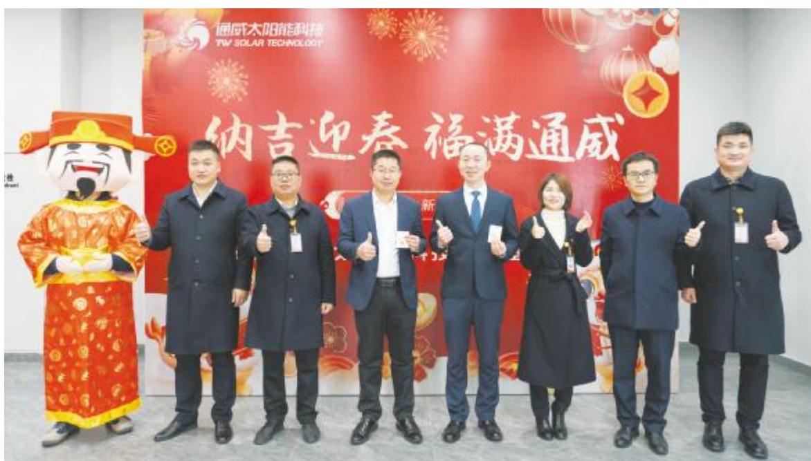
盐城基地“纳福迎春 乐满通威”活动合影留念