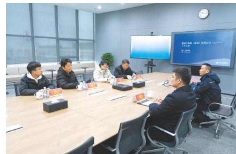
通威太阳能科技盐城基地迎接盐城市复工复产安全生产专项督查

部门的协作,深入挖掘和分析评比标准,全面了解业务需求,通过五型班组的评比和优秀经验的分享,推动各厂部持续优化班组建设,助力公司实现高质量发展。