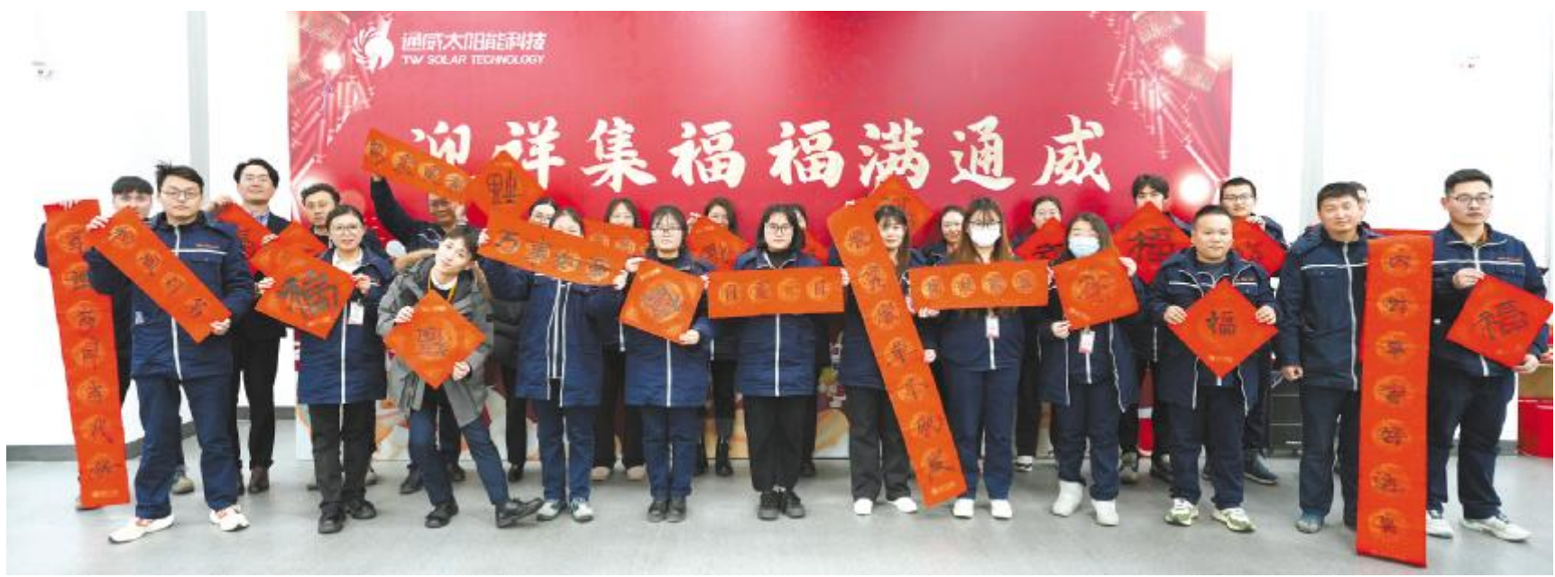
通威太阳能科技写春联送祝福活动合影留念