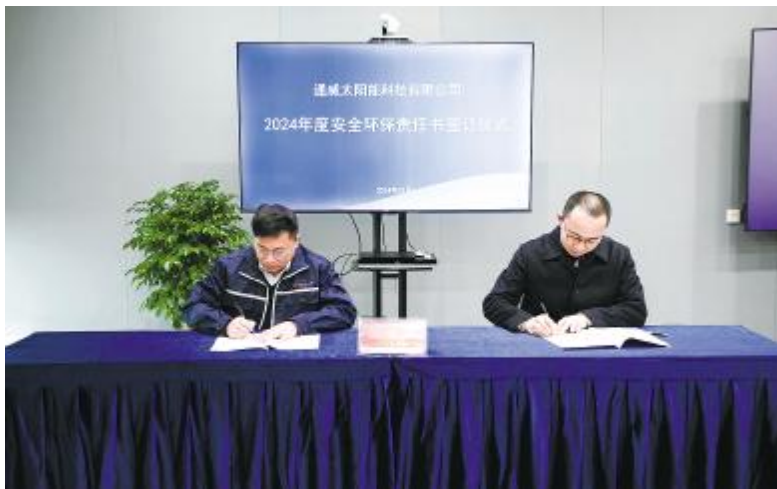
签订安全环保责任书