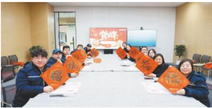
盐城基地写春联送祝福现场