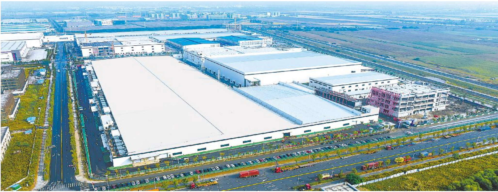
通威太阳能科技南通基地