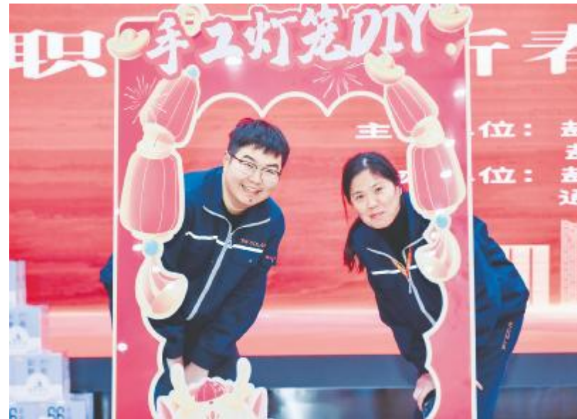
新春打卡,幸福满满

春节是一年中最重要的节日,是团圆的日子,是相聚的时间。在外一年,无论路程多远,不管工作多忙碌,春节时总要回家,与家人唠唠一年的思念与牵挂,与亲友聊聊一年的欢喜与收获。“过年”是中国人的独特情愫,是烙在每个人心头的浓郁乡愁,是岁末年初不变的亲情守望。龙行龘龘,前程朤朤。龙年春节前夕,通威太阳能科技组织开展丰富多彩的迎新春活动和丰厚的春节福利,为全体员工送上新春的祝福,感谢每一位员工的辛勤付出,让大家切实感受到公司的关怀。