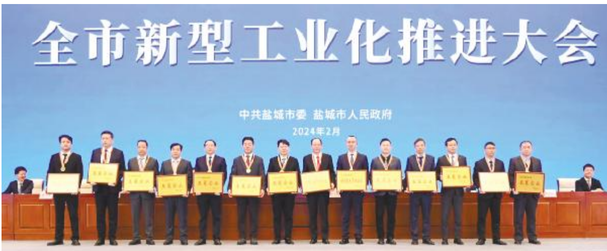
盐城基地入选盐城市 2023 年度“争星创优”活动优胜企业