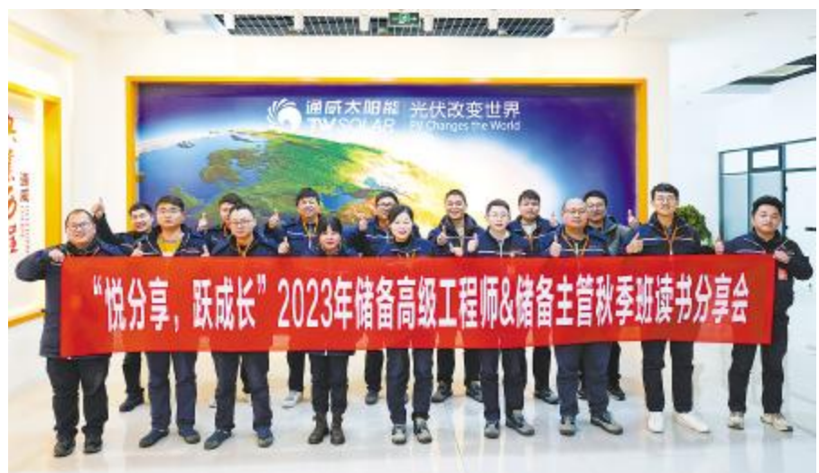
通威太阳能科技合肥基地举办储备高级工程师及储备主管秋季班读书分享会