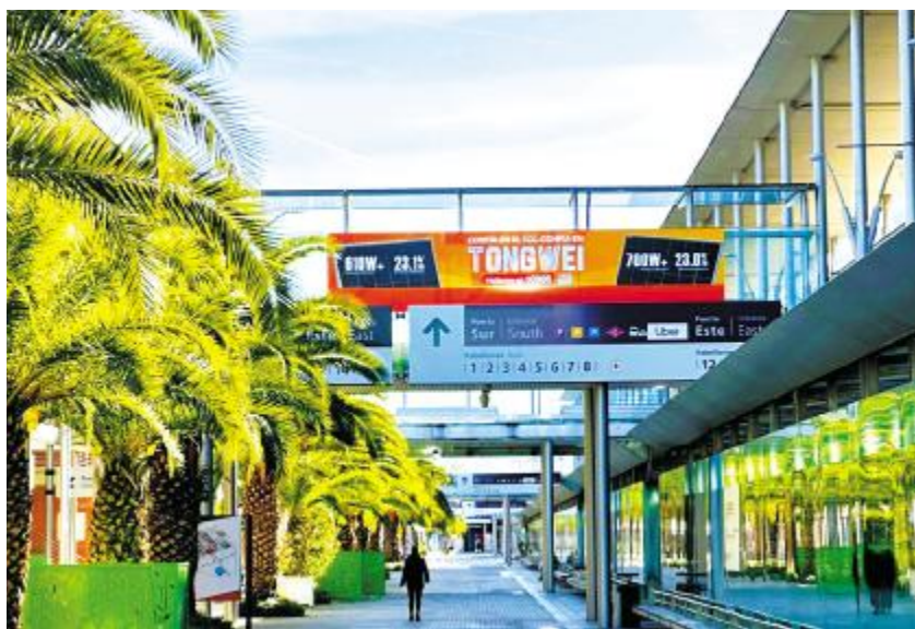
通威“智造”亮相西班牙马德里各大主要交通枢纽

在波兰市场,使用通威光伏组件的项目不断涌现,通威联合以Solfinity为代表的经销商,因地制宜,采用适应波兰气候环境和地理条件的组件产品,在波兰不断推动光伏发电项目的落地。通威光伏组件的高效率和优质性能,得到了波兰市场的高度认可。