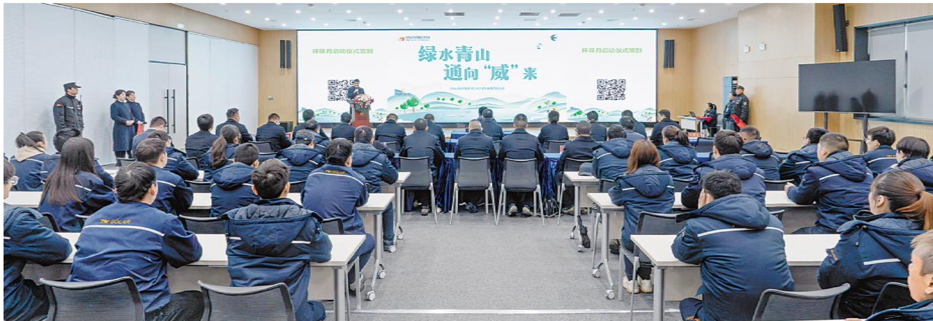
通威太阳能科技 2024 环境保护月盐城基地启动仪式现场

通过开展学员与导师座谈会,深入了解各培养班学员的工作及学习情况,强化学员与带教导师之间的高效沟通,助力培养班学员成长发展。