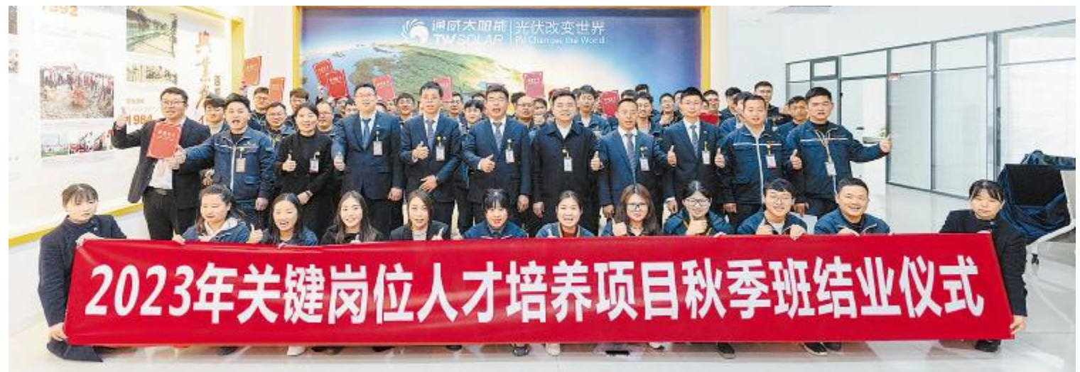
通威太阳能科技 2023 年关键岗位人才培养项目秋季班结业仪式合肥基地合影留念