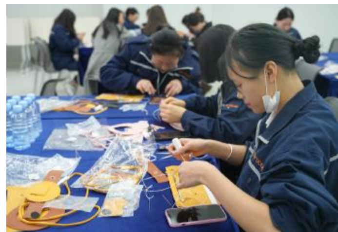
金堂基地开展妇女节手工制作活动