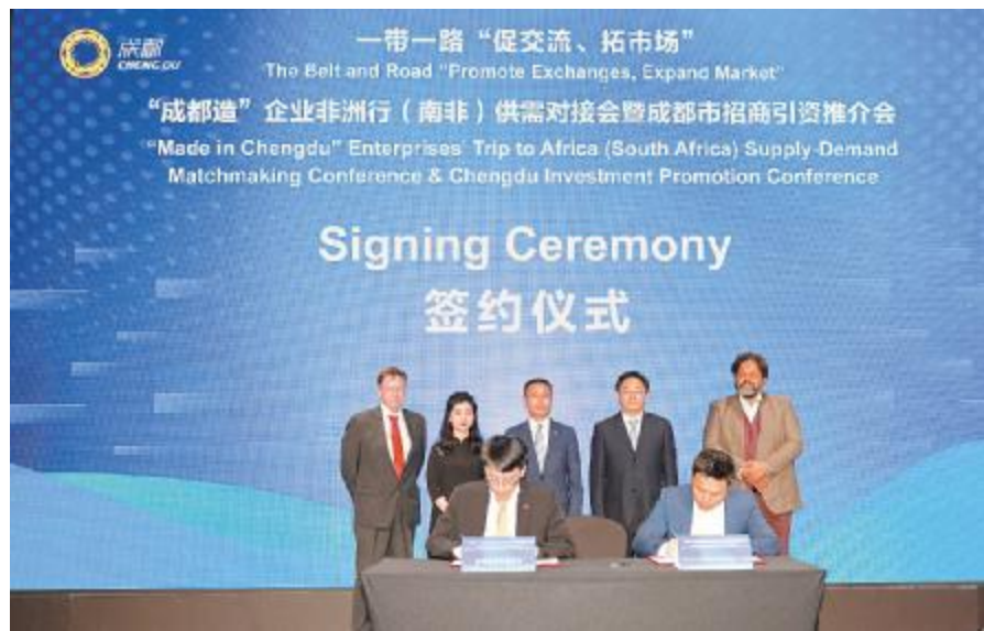
通威与海兴电力签署 150MW 高效组件采购协议