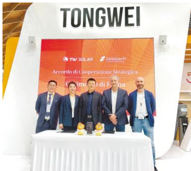
通威与 Zeliatech 签署 250MW 合作协议