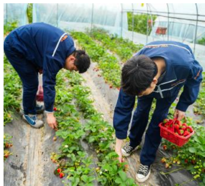
采摘草莓,享惬意生活

通威太阳能科技一直致力于打造温馨、和谐的工作环境,注重员工的成长与福利。未来,公司工会也将持续创新关怀模式,丰富文化活动形式,与员工共奋斗、同分享,助推公司高质量发展。