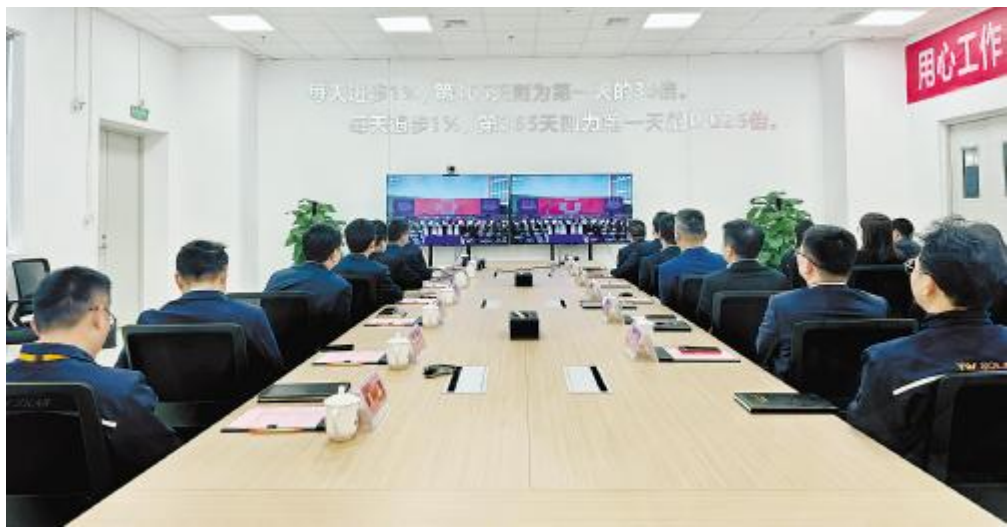
通威太阳能科技南通基地收看集团企业文化启动仪式视频直播

刘汉元主席指出,通威自己独有的企业文化,完完全全立足于以前走过的路、做过的事,并在此基础上的梳理和总结,而不是从别人那里拿来套在我们身上的一件“外衣”。一直以来,通威太阳能科技植根文化沃土,传承发扬,不断创新形式,让通威文化在各大新基地落地生根,在新员工中萌芽。为发挥文化引领作用,3月以来,通威太阳能科技组织开展员工生日会、主题征文活动、节日送祝福、趣味竞赛等形式多样的文化活动,丰富员工文化生活,凝聚齐奋进、共战斗的向心力和战斗力。