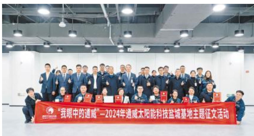
盐城基地“我眼中的通威”主题征文活动决赛合影留念