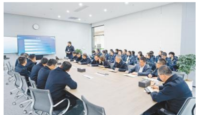
盐城基地举行月度安全环保会议