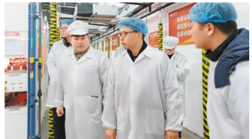
合肥基地开展月度综合安全检查