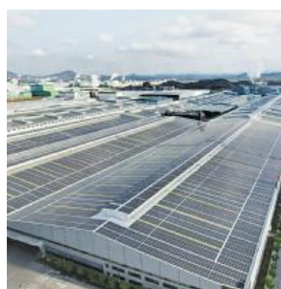
通威高效组件助力广西藤县蒙娜丽莎 85MW 综合智慧能源项目并网

中信博是全球领先的光伏跟踪支架、固定支架及 BIPV 系统制造商与解决方案提供商,在 BIPV 领域推出智顶、双顶、睿顶及捷顶四大创新解决方案。通威高效组件与四大创新解决方案均可完美适配。此次藤县蒙娜丽莎 85MW 综合智慧能源项目成功并网,不仅刷新了华南 BIPV 项目的装机规模,也为全国大型分布式光伏项目建设提供创新应用模式。