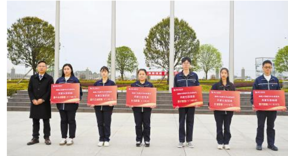
金堂基地表彰月度五型班组

随着员工法律意识的逐步加强,企业面临的劳动风险也日益复杂和多样化,为保障企业的稳定发展和员工的合法权益,企业风险管理越来越重要。通过本次全面的法律知识赋能,进一步强化了风险防控,促进合规管理,为公司的稳健发展保驾护航。