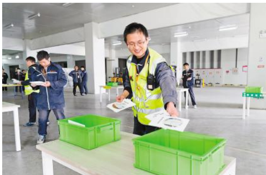
通威太阳能科技固废分类竞赛活动合肥基地现场