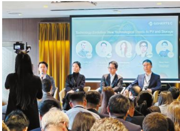
通威出席中意新能源合作论坛

一系列的合作成果,并非一蹴而就,而是双方基于对彼此的详细了解。各合作方通过营销平台、线下展会等多种渠道,全面深入了解了通威的组件产品,对通威智造、服务的高度肯定,为合作打下了坚实基础。