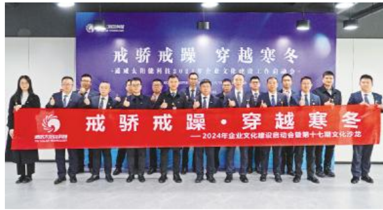
通威太阳能科技盐城基地合影留念