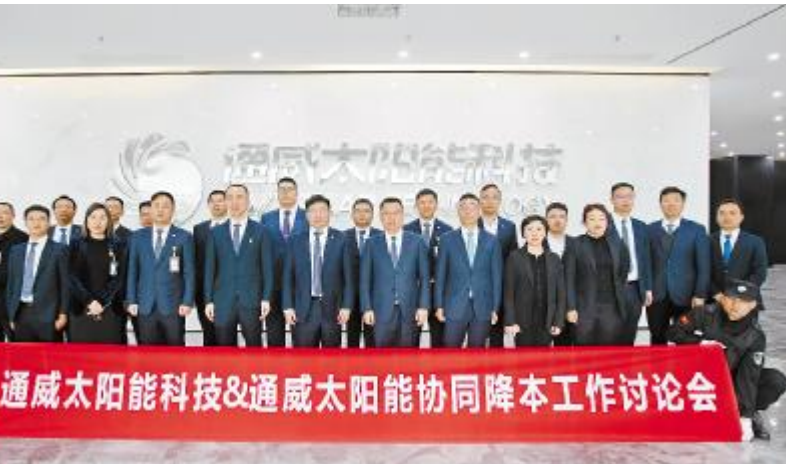
通威太阳能科技 & 通威太阳能召开协同降本工作讨论会议

萧总表示,通过充分的讨论,双方达成了“拧成一股绳的力量,才能拥有更具竞争力产品”的共识。通威一直秉持产品质量第一的理念,要通过创新技术,把新技术、新产品、新工艺等应用到生产经营中,不