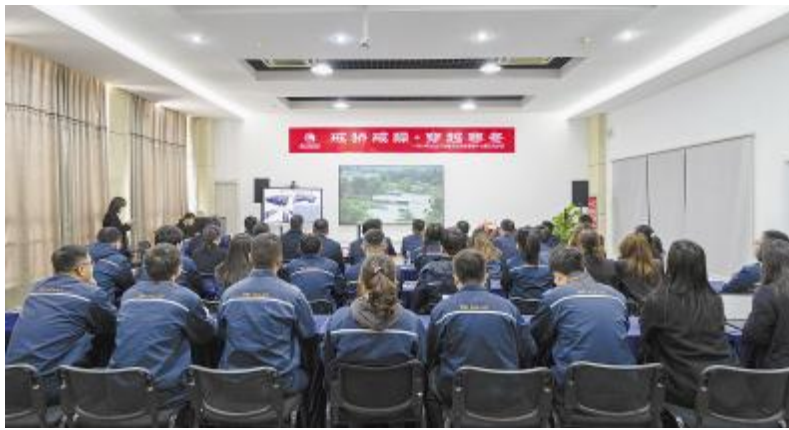
通威太阳能科技合肥基地活动现场