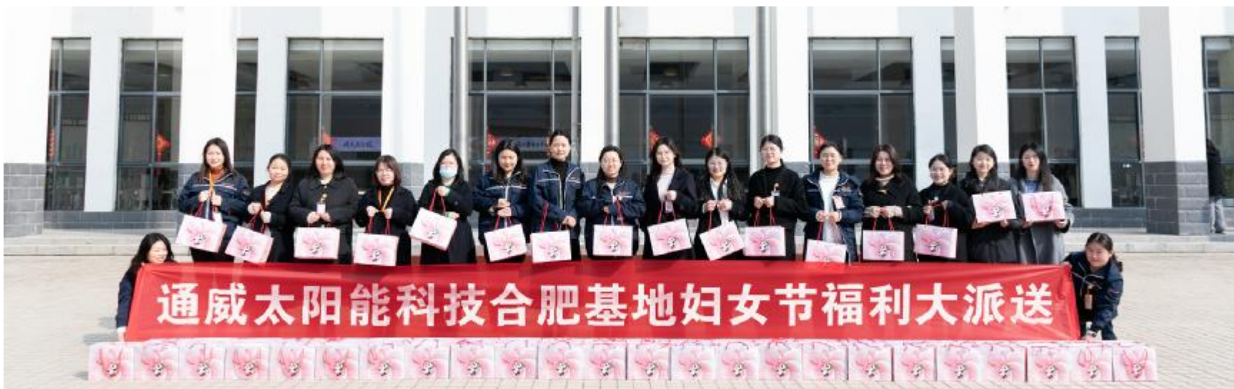
通威太阳能科技妇女节主题活动合肥基地合影留念