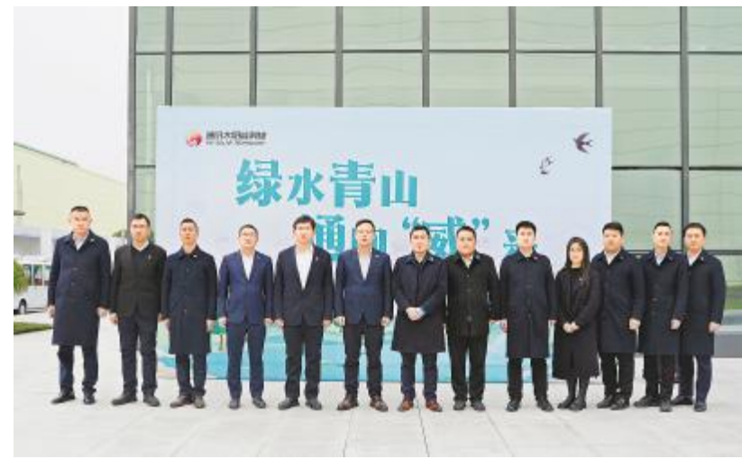
通威太阳能科技 2024 年环境保护月启动仪式金堂基地合影留念