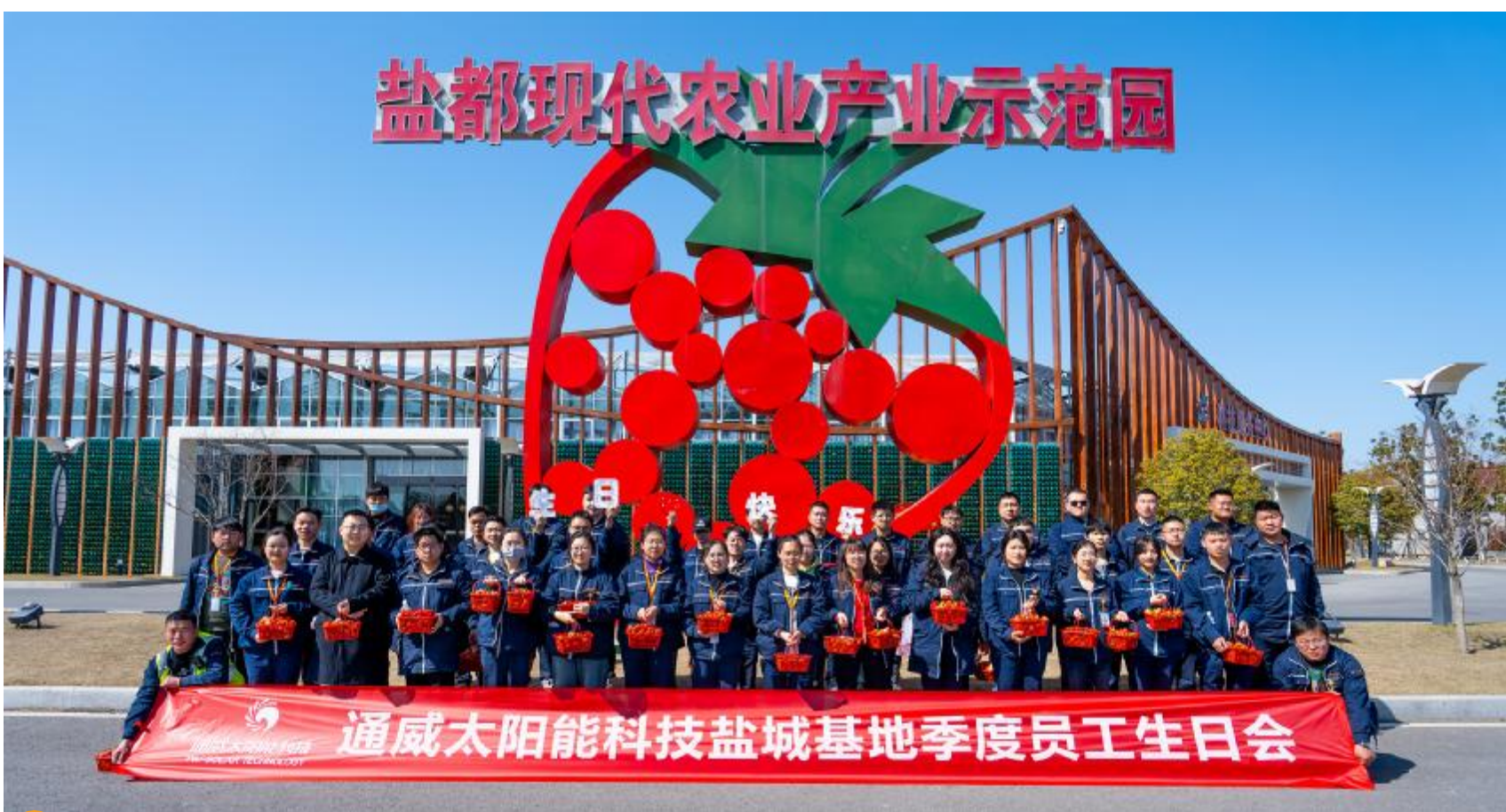
通威太阳能科技一季度员工生日会盐城基地合影留念