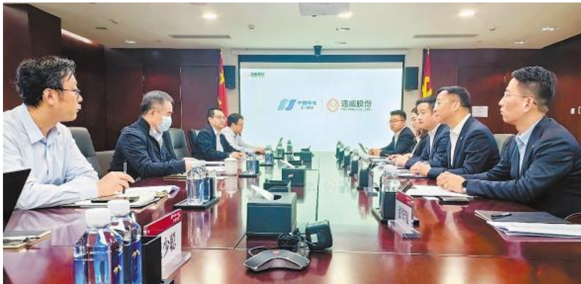
通威股份光伏商务部与中国华电集团物资公司座谈交流