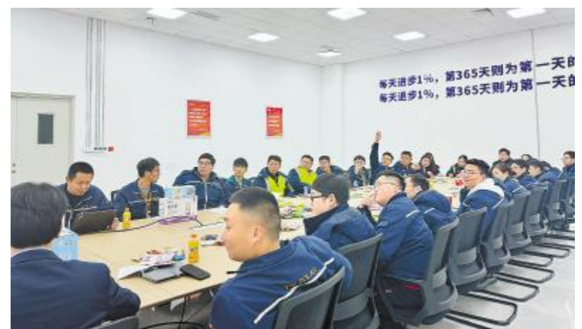
南通基地举行各培养班学员及导师座谈会