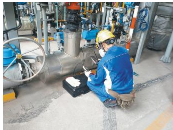
巡检工作人员按清单检测露点