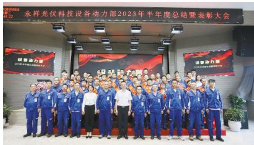
永祥光伏科技设备动力部 2023 半年度总结暨表彰大会现场

内蒙古通威硅能源开工建设以来,建设团队深刻理解“高效经营、执行到位”的经营管理思路,遵照“工艺先进、装备精良、安全高效、造价合理、工匠施工、团队匹配”的精品工程建设理念,不断增强经验转化能力和技术创新能力,聚焦“安全、质量、进度”关键点,把打造精品工程落到实处。