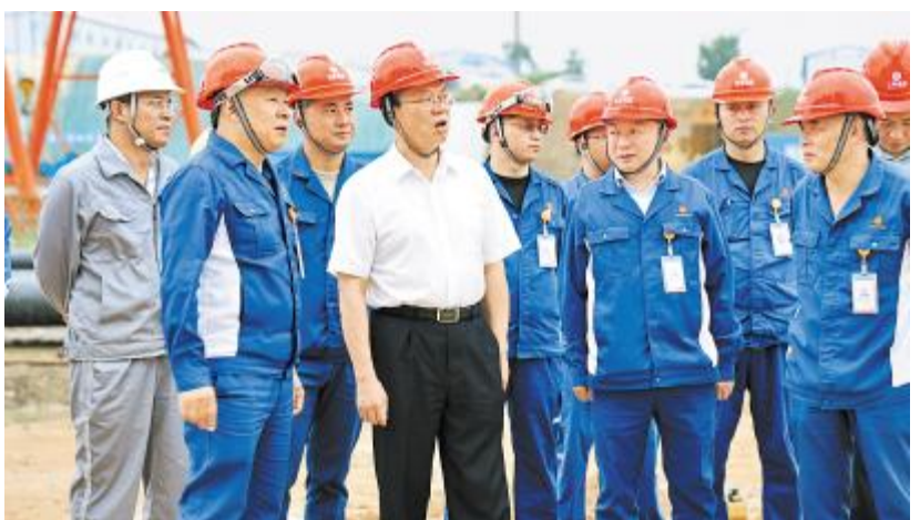
保山市委书记杨军莅临云南通威二期项目建设现场调研

康院士对永祥绿色高质量发展给予高度评价,并表示,永祥始终坚持自主研发,推动了国内多晶硅生产工艺的不断优化和完善,在技术、成本、质量、规模上不断赶超欧美,实现全球领先。希望永祥继续加强技术研发投