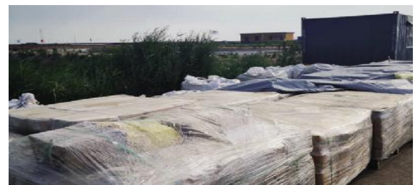
为设备物资穿上防护“雨衣”