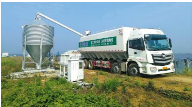
通威和县“渔光一体”基地利用散装车为料塔上料