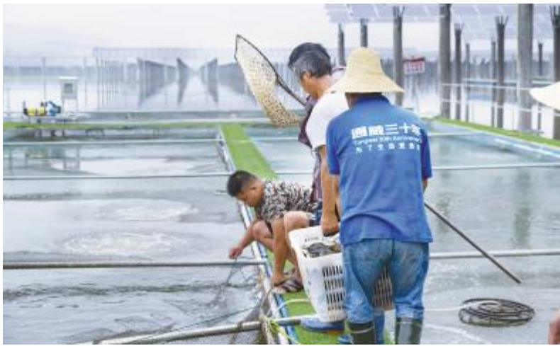
通威西昌“渔光一体”基地热水鱼喜获丰收

后,水质变瘦,天然饵料生物量减少,难以保证水产动物正常生长的营养需要,因此,应选择配合饲料,加大饲料投喂量,并坚持“四定、四看、一检查”投饵法,即定时、定位、定质、定量,看天气、看水色、看水产动物吃食、看水产动物活动,检查水下有无残渣剩饵,同时拌料投喂维生素C(每千克饲料用300~500毫克),每天一次,连喂5~7天,以提高养殖动物的抗病能力,预防病害的发生。