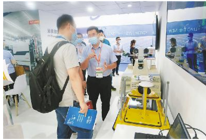
展商了解通威新能源终端海陆空无人巡检设备