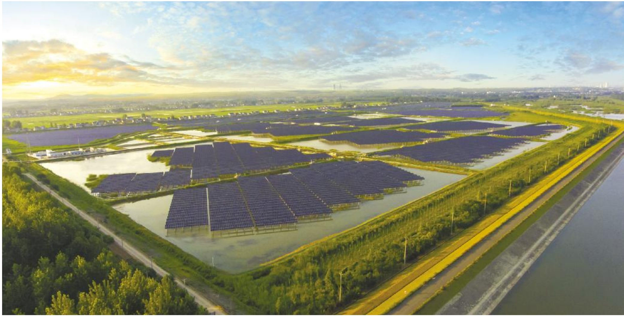
通威龙袍“渔光一体”基地