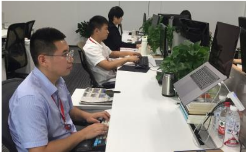
渔光物联 AI 团队