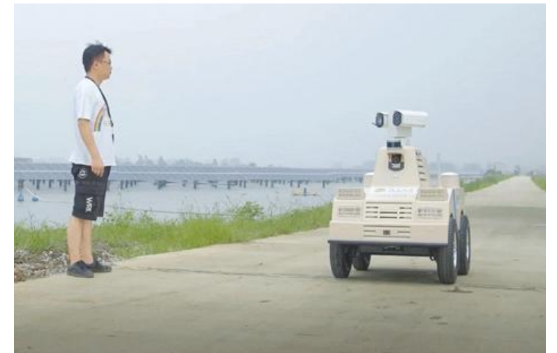
测试光伏巡检无人车