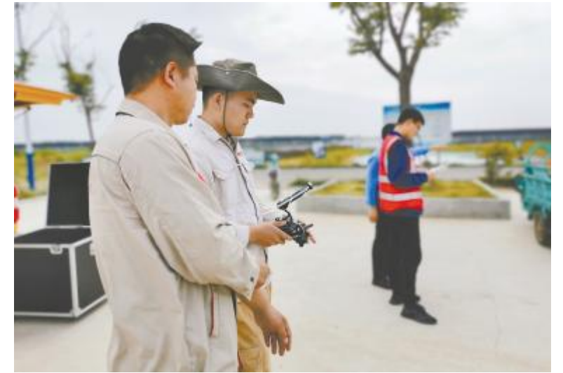
渔光物联 AI 团队正在进行设备测试