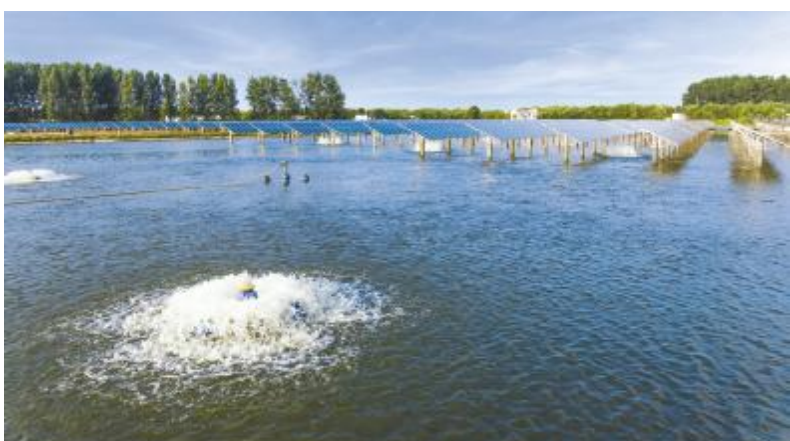
通威扬中“渔光一体”基地进行增氧作业