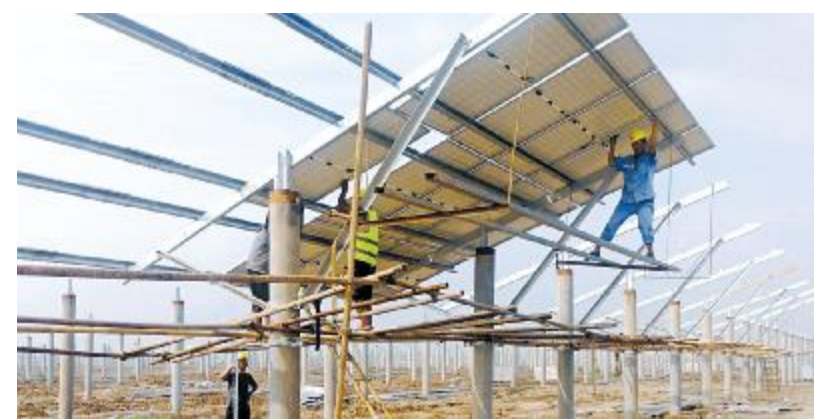
抢抓晴天间隙进行组件安装