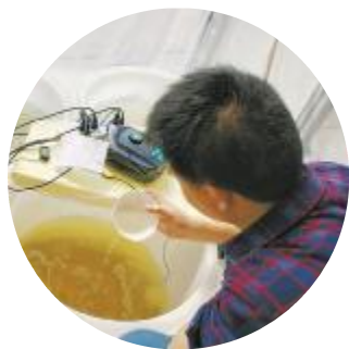
通威和县“渔光一体”基地工作人员在开展南美白对虾试水试验