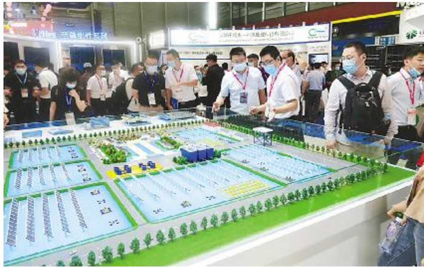
展商观看沙盘模型,体验通威“渔光一体”魅力