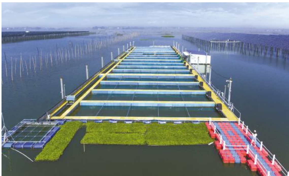
通威泗洪“渔光一体”基地漂浮式流水槽