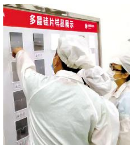
永祥硅材料推行“一岗精、二岗通、三岗会”培养计划

据悉,为提高员工的操作技能,推进人才储备,使品管部各岗位无缝链接,实现安全、高效生产,永祥硅材料品管部包装三班推行“一岗精、二岗通、三岗会”培养计划。工作之余各班组成员相互学习,提出自己的不足之处,分析原因提出解决方案,实现每个组员会做、能做、做精、做细,真正知