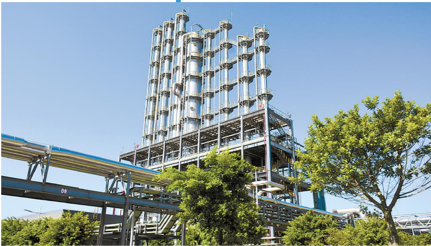
永祥多晶硅绿色厂区