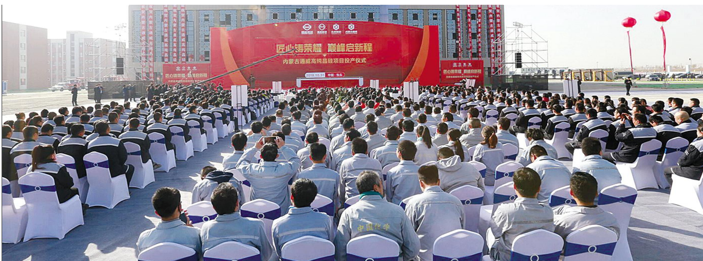
项目投产仪式现场