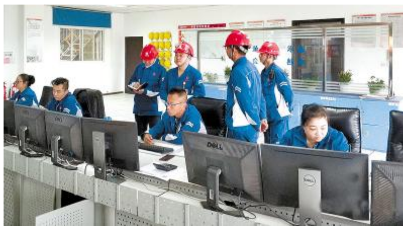
段雍董事长视察永祥新材料中控室