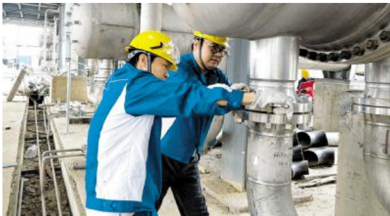
内蒙古通威高纯晶硅投产前紧锣密鼓地进行设备调试