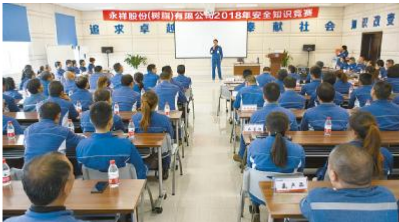
永祥树脂成功开展2018年安全知识竞赛决赛