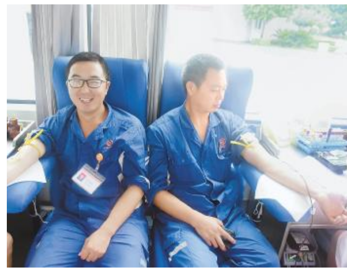
永祥股份员工积极参与献血活动

相关负责人告诉记者,这是一份“生命的礼物”,组织、参与无偿献血活动,体现了永祥企业及员工的社会责任感,彰显了企业和员工无私奉献的精神,传递了正能量。