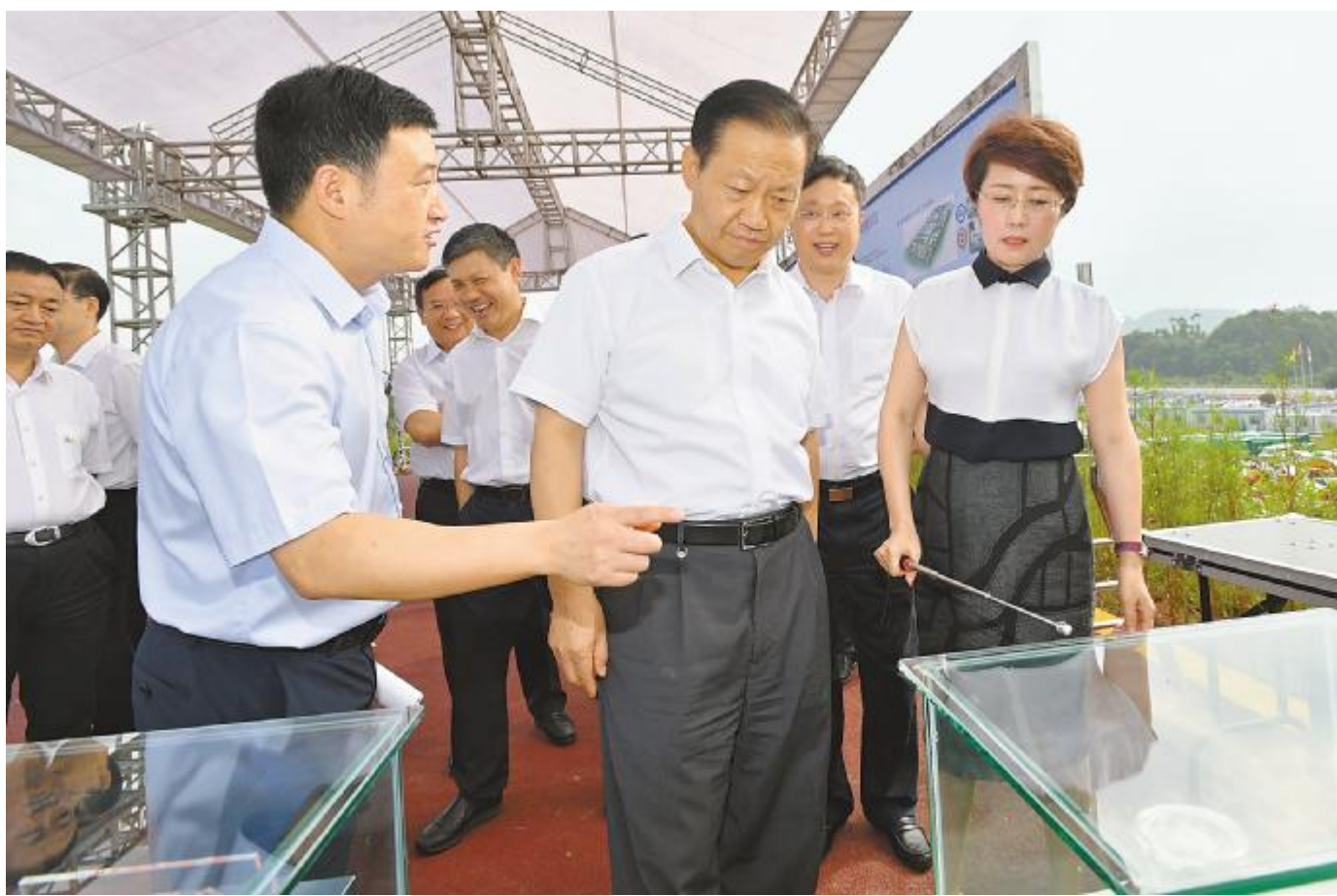
段雍董事长向彭清华书记介绍永祥晶硅产品

随后,彭书记现场查看了永祥高纯晶硅硅棒、单/多晶料、高效硅片等产品,关切地询问其工艺特点、主要性能、质量优势及市场前景。通过实地调研和听取汇报,彭书记对永祥发展取得的成果给予高度肯定,希望永祥股份进一步抢抓机遇,找准定位,发挥优势,真抓实干,为推动经济高质量发展夯实产业支撑,进一步树牢“绿水青山就是金山银山”的理念。