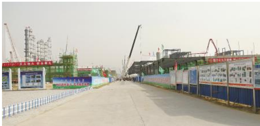
干净整洁的厂区大道

保证安全,最根本的办法是要形成安全文化,让员工掌握安全技能,入脑入心,潜移默化,变成习惯,从源头上规范员工行为,争做精细化管理的“活水”,便有了创业创造、建功立业的不竭“源泉”。公司正是通过文化引领,形成了属于内蒙古通威高纯晶硅的“成就之源”,让整个团队坚定了绿色发展、安全发展的信念。