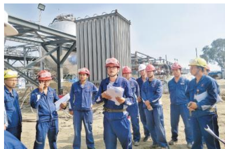
内蒙古通威高纯晶硅开展JCC现场检查和培训