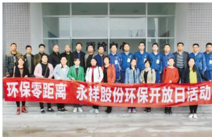
环保开放日,社会公众走进永祥股份厂区参观