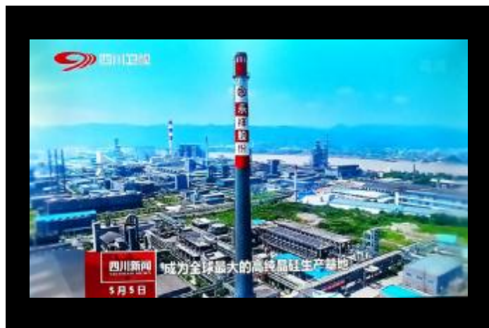
四川卫视《四川新闻》专题报道永祥股份发展

永祥旗下永祥多晶硅、永祥树脂、永祥新材料也先后多次举办了员工家属接待日活动、环保开放日活动,通过第三方的耳闻目睹,传递通威、永祥“为子孙留住青山绿水,白云蓝天”坚定不移的环保理念,树立良好的企业形象。同时,永祥还举办“应届大学生”进永祥交流活动,邀请来自四川大学、重庆大学、西南科技大学、西南石油大学、西华大学、成都理工大学等高校学子走进永祥参观了解,在展示永祥企业形象的同时,也为永祥人才储备、吸收优秀高校人才奠定了坚实的基础。