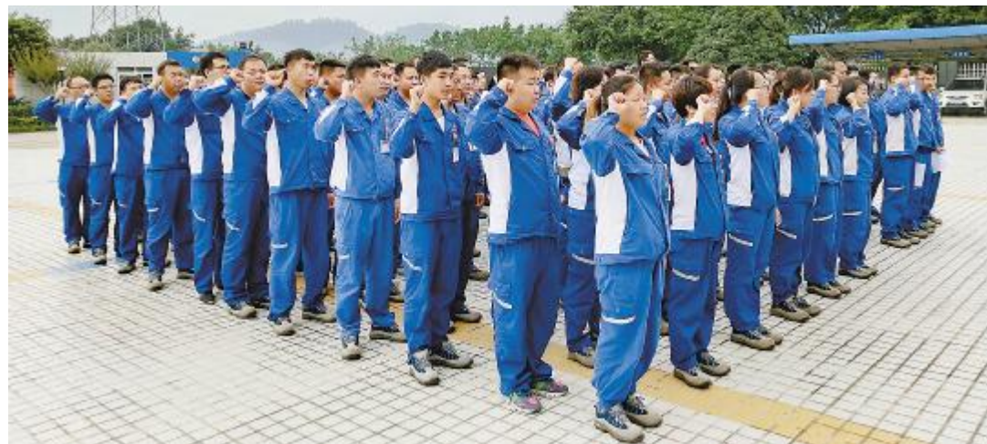
公司员工朝气蓬勃