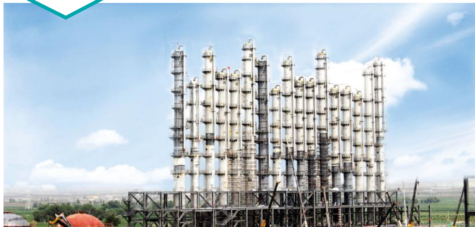
永祥股份包头高纯晶硅项目建设现场

进入8月,永祥股份乐山、包头两地高纯晶硅项目均迎来建设关键时期,保安全、保工期成为当前重点。