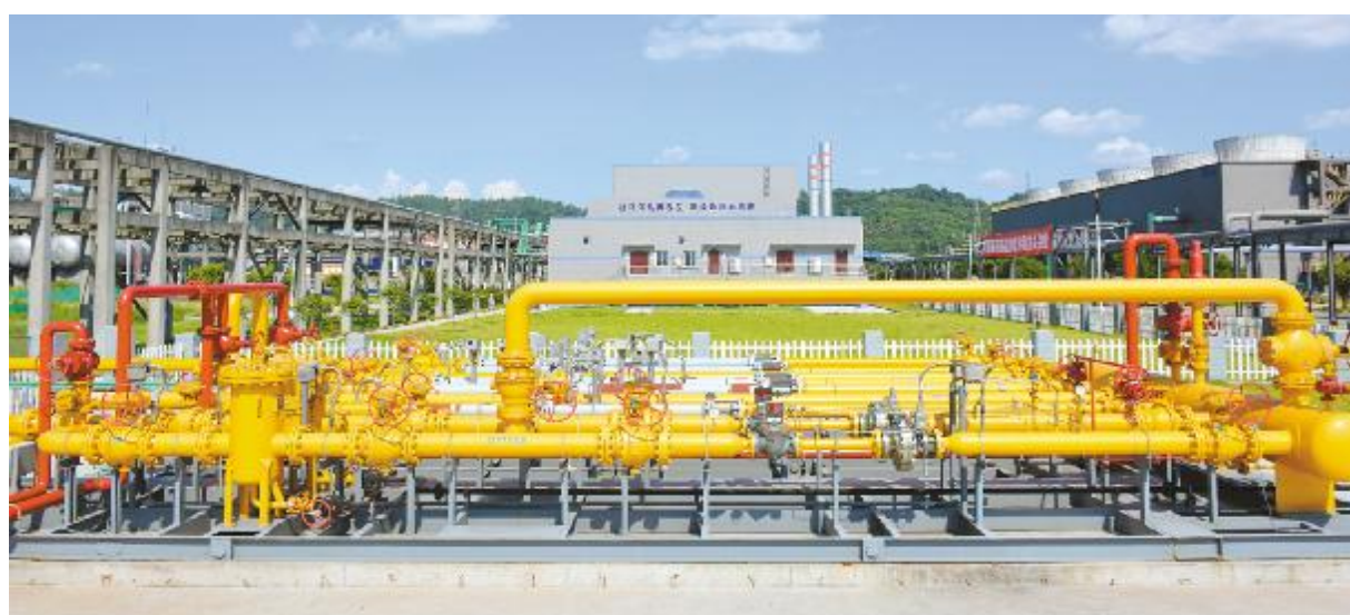
永祥股份今年投入使用的煤改气环保设施