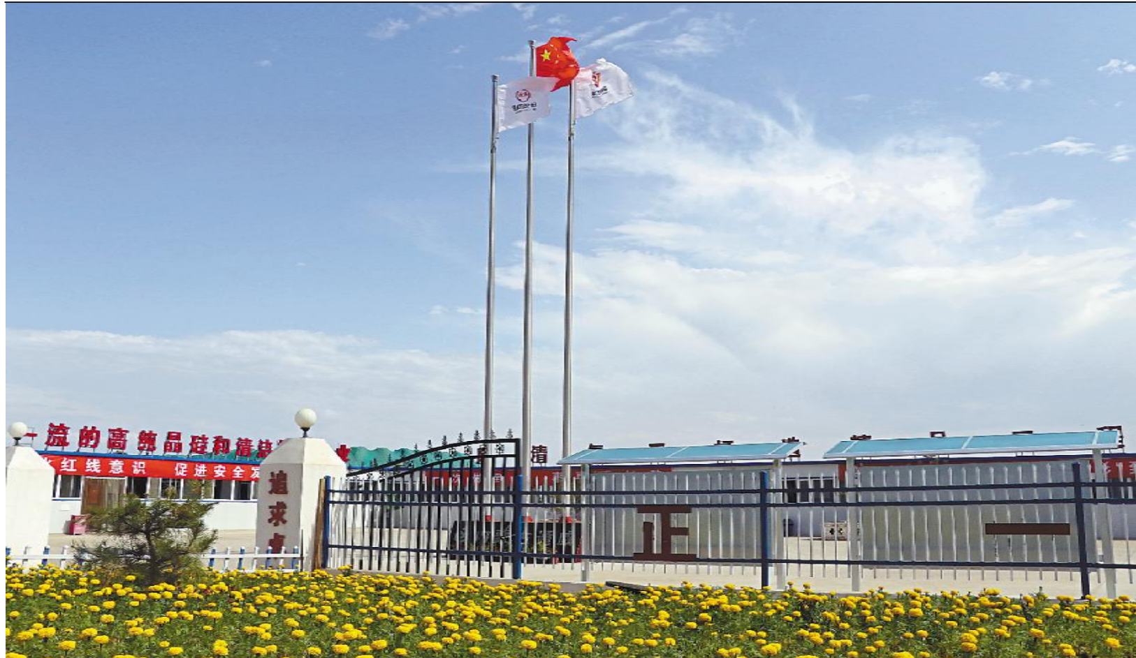
内蒙古通威高纯晶硅公司大门,鲜花盛开