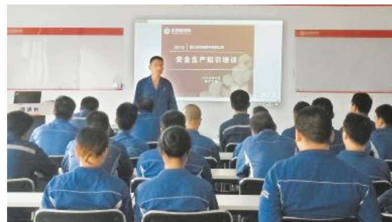
永祥硅材料开展安全生产知识培训