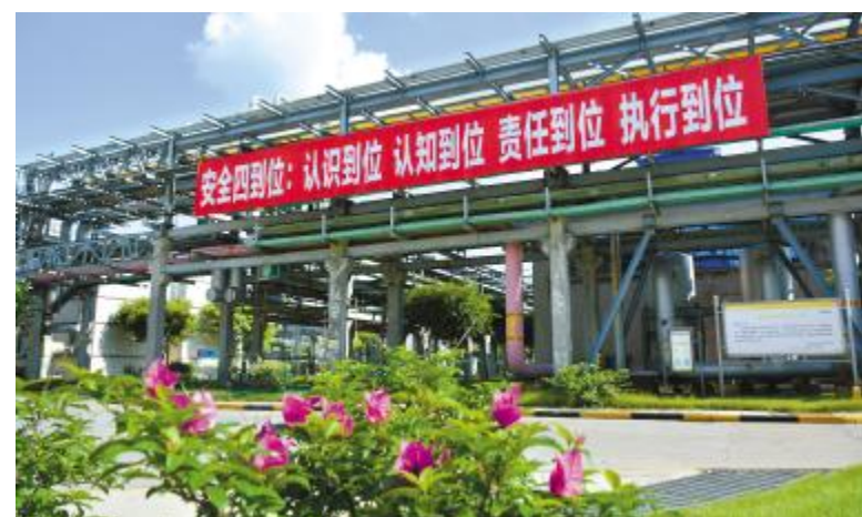
永祥树脂厂区内,安全标语随处可见

警铃一响,公司消防队第一时间投入“救援”,消防员以快速连贯、准确娴熟的动作穿戴好正压式空气呼吸器,准确连接水带接口后,用力将水带呈一条直线甩出,随后拿起水带迅速向前跑开,一边跑一边连接水枪头,整个消防演练过程六名消防员紧密配合,整套动作一气呵成。此次消防演练活动,有效加强了消防员安全意识,为厂区未来打造一支专业化、迅速化和全能化的消防队伍奠定基础。